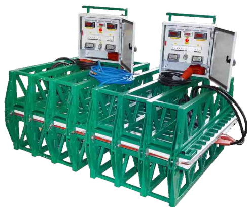
Вулканизатор конвейерный ВК-1000/1500